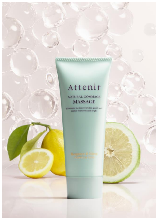
みずみずしく深みのある柑橘の香りをプラス。

*5つの植物保湿成分 ゴールデンカモミール・カミツレエキス・フィーメールマントル®・スーパーゼニアオイエキス・オオアザミ果実エキス