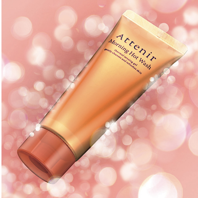
シトラスハーブの香り