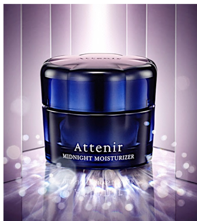
ナイトリラックスアロマの香り