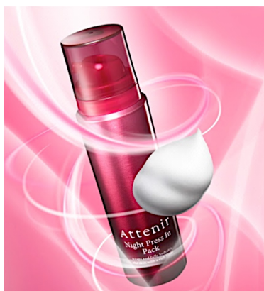
リラックスハーブの香り

内容量: 70g(約2~3ヵ月分) ※週2~3回使用 / 目安量: 大きめのさくらんぼ大