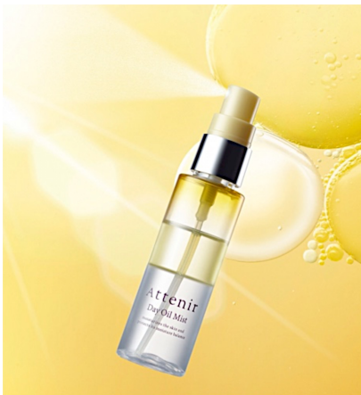
ほのかなフラワーハーブの香り