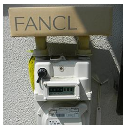
ガスメーターボックス