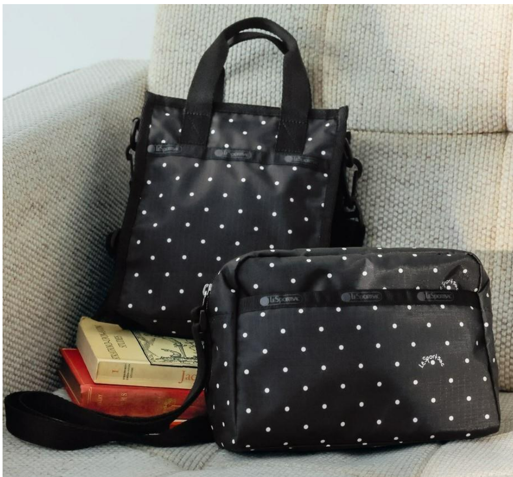
左から、ミニ N/S トート、ダニエラクロスボディ