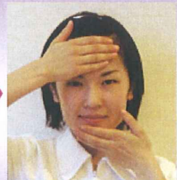
④最後に額とあごも忘れずに