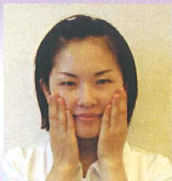
①化粧液は暖かい手で、手のひらで抑えるように