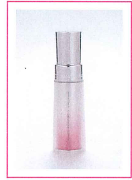
「ビューティコンセントレート」