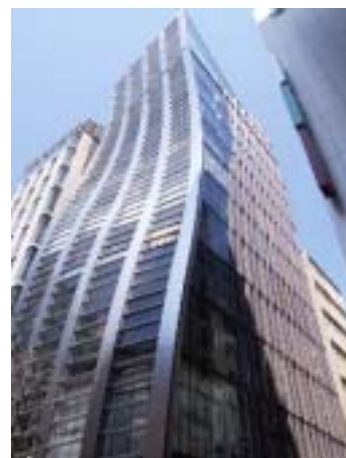
ファンケル健康院

営業時間 | 午前10時～午後6時(日・祝日を除く) 住 所 | 〒104-0061 東京都中央区銀座2-5-11 デピアス銀座ビル3F 電話番号 | 0120-561-287 FAX番号 | 03-5524-7871 ホームページ | www.kenkoin.jp