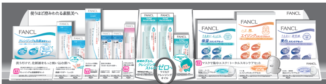
※店頭展開 イメージ

このたび発売する商品は、ファンケルでは初となる炭酸ガスを配合したエアゾール容器の泡洗顔料「クリーミィ泡洗顔料<本体価格1,600円(税込1,728円)>」、携帯に便利なミスト状の化粧水「ミストローション モイストチャージ<本体価格1,500円(税込1,620円)>」、肌の悩み別に選べる1泊分のスキンケアセット2種「美白スキンケアセット*1<本体価格840円(税込907円)>」「エイジングスキンケアセット<本体価格900円(税込972円)>」、大人気のマイルドクレンジングオイルと洗顔パウダーをセットにした「クレンジング&洗顔 携帯セット<本体価格500円(税込540円)>」の5アイテムです。