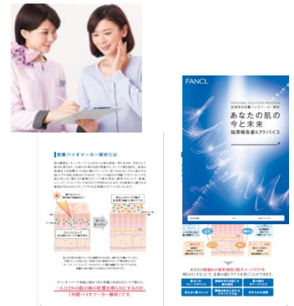
※専用のアドバイスシート

また2015年5月19日には、『スキンソリューション』の情報サイト(URL: www.fancl.jp/ss )を開設。「パーソナルソリューションプログラム」をご紹介 し、美容意識の高い女性との接点機会創出を図ってまいります。