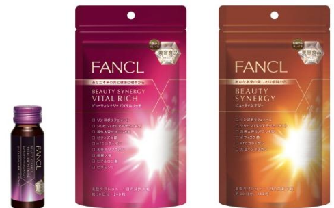
「ビューティシナジー」シリーズ

美しさの根幹からエイジングへアプローチする美容食品「 ビューティシナジー 」シリーズは、大人の美しさとはつらつとした日々をサポートする13種類美容成分を1本に凝縮したプレミアム美容飲料「 ビューティシナジー バイタルリッチ ドリンク 」と、美と健康の根幹に働く美容成分9種を配合したタブレットタイプの「 ビューティシナジー バイタルリッチ 」、内側から輝く美しさを導くタブレットタイプの「 ビューティシナジー 」の3アイテムで展開いたします。