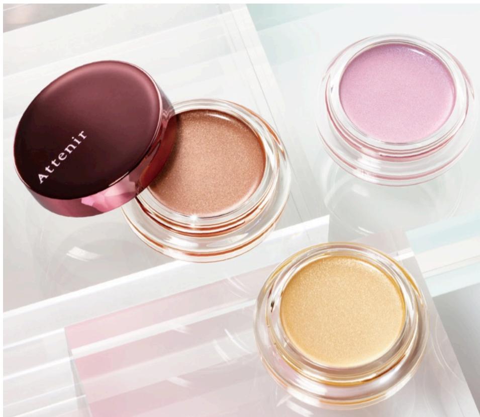
写真左から(ハニーブラウン・イエローゴールド・モーブピンク)

パールが陰影をつくるため、1色で上質な濡れ艶と自然な立体感を演出。目もと全方位、どこから見ても上品な輝きを放つ新感覚のジェル状アイカラーの登場です。うるおいのあるジェルがまぶたにしっかりピタッ！とフィットして、つけたての色が長時間続きます。さらに、メイクライン共通の「隠しピンク設計」*1により、大人のメイク悩み“くすみ”を取り払い、肌映えのする美しい仕上がりになります。