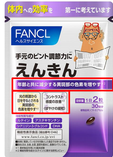
※赤枠内 新デザイン

今回、従来から「えんきん」に配合している成分である「ルテイン」の研究レビュー(システムティックレビュー)を新たに実施しました。その結果、「えんきん」の機能である「手元のピント調節機能を助ける」、「目の使用による一時的な肩・首筋への負担を和らげる」に加え、「ルテイン」が「 光の刺激から目を守るとされる黄斑部の色素を増やす 」、「 コントラスト感度が改善する(ぼやけの緩和によりはっきりと見る力を助ける) 」ことを確認しました。これにより、年齢を重ねた目のさまざまなお悩みに対応する製品へと進化し、パッケージは「ルテイン」の二つの機能を強調して記載したデザインに生まれ変わりました。