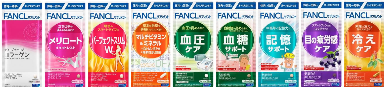
流通専用サプリメント 第2弾

※参考リリース「流通専用のサプリメントを開発」( https://www.fancl.jp/news/pdf/20190320_ryuutsusenyousapli20days.pdf )