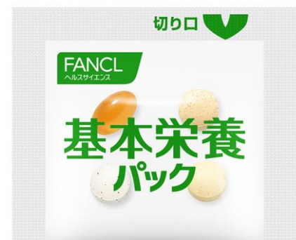
1回分がワンパックとなった「個包装」