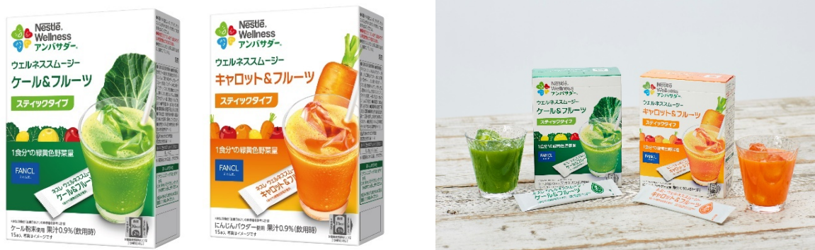
写真(左から):「ネスレ ウェルネススムージー ケール&フルーツ」「ネスレ ウェルネススムージー キャロット&フルーツ」