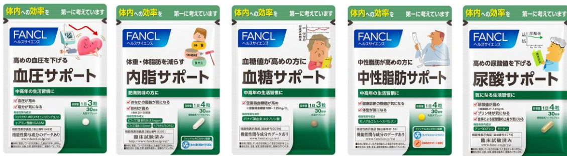
「健康数値サポートシリーズ」5製品

2019年4月から通信販売と直営店舗、一般流通で、さまざまな生活習慣に関するお悩みに対応する製品として、「血圧サポート」「内脂サポート」「血糖サポート」「中性脂肪サポート」「尿酸サポート」の5製品をシリーズ展開しています。お客様の健康悩みをサポートするラインアップとして強化してまいります。適度な運動とバランスの良い食事とあわせ楽しく健康的な毎日へ、ぜひお役立てください。