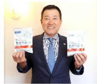
読売巨人軍 原辰徳監督

2月22日(月)、読売巨人軍がキャンプ地である沖縄県那覇市に開設した「読売ジャイアンツ・スポーツ健康検査センター」に、「免疫サポート(60粒)」2,000個を寄贈いたしました。同センターは、読売巨人軍など沖縄県内でキャンプを実施する一般社団法人日本プロ野球機構の球団やJリーグのクラブ、報道陣などの方に、定期的にPCR検査を実施する目的で開設されました。寄贈は、PCR検査を受診した巨人軍の選手やスタッフの健康管理に役立てていただくために実施しました。