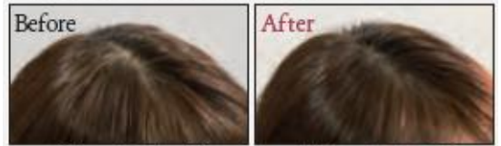
ボリュームのない髪