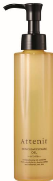
『スキんクリア クレンジング オイル アロマタイプ』