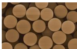
均一なスキントレーサー粒子

真球状で均一なサイズの粉体で、肌に均一にのび広がり、肌の凹凸をムラなくカバー。小ジワや毛穴を目立たせず、朝の美しい肌が続きます。