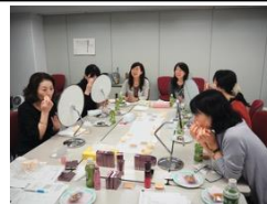
アテナア アンバサダーの皆様との会議の様