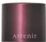
(パフ表面に1回分の中身がつくので、キャップを回して開けて使用。)

肌にツヤと血色感をプラスし、一気に表情の鮮度をアップさせる大人メイクの救世主アイテム。コンパクトサイズで狙ったところにポンポンと入れやすく、クリーム状だから肌に溶け込むように密着。内側から上気しているような、幸せあふれる印象をキープできます。