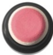
なめらかでしっとりしたクリームタイプ。