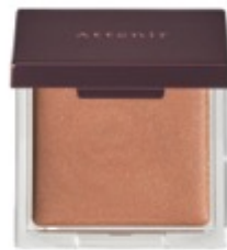
化粧直しに便利な鏡付き。ジェル状。