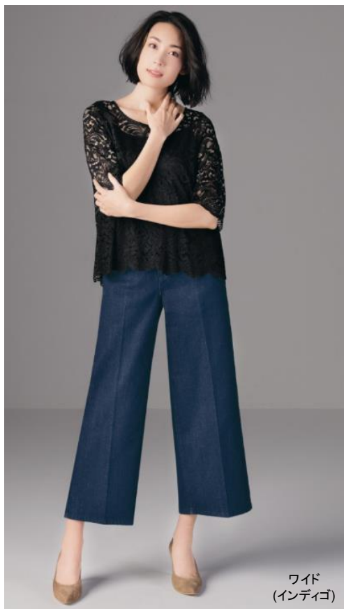
ワイド (インディゴ)